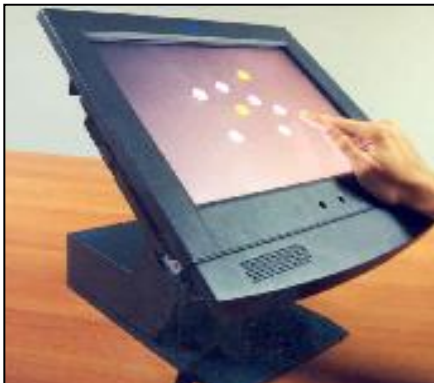
האבחון אורך כשעה של עבודה מול מסך מגע, הדוחות מתקבלים במהירות וביעילות